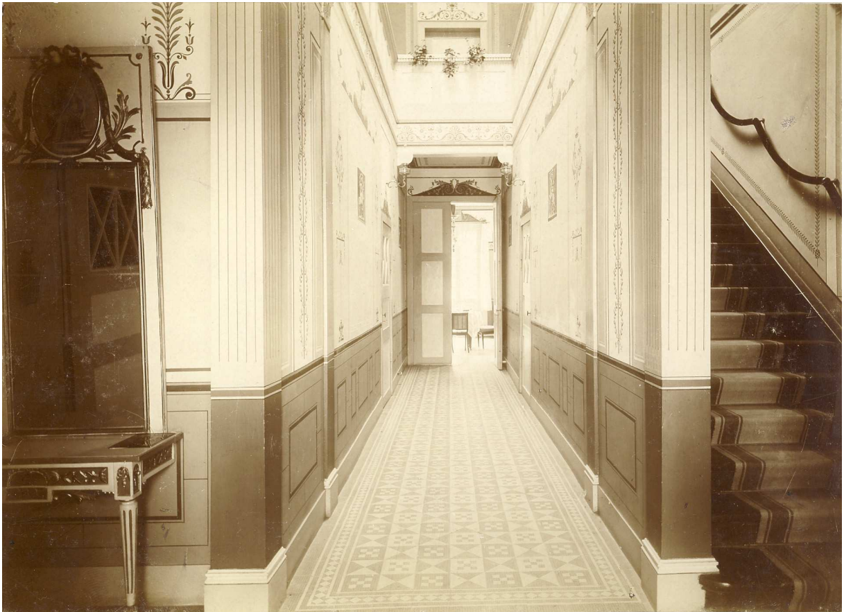
7 Das offene Treppenhaus, 1894