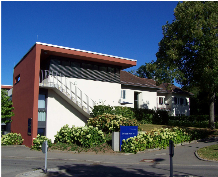
Die Diakonie Stetten, 2012