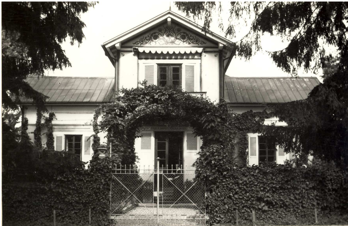
Der Eingang mit der Inschrift „Parva domus magna quies“, 1894