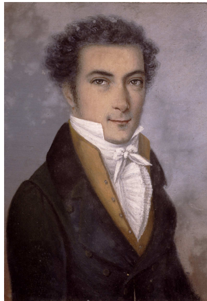
Karl Ludwig von Zanth, 1796 – 1857

pompejanischen Stil mit Kirche und Schloss durch Zanth erregte das Interesse König Wilhelm I. So konnte er zunächst nach der Rückkehr aus Ungarn, wo er die Ausführung seiner Pläne selbst geleitet hatte, mehrere Privathäuser im pompejanischen Stil realisieren. Dazu zählten 1835/36 ein Wohnhaus am Fleiner Tor in Heilbronn für den späteren Minister Adolf Goppelt, 1836/37 das Landhaus für Friedrich Notter am Bergheimer Hof, 1837 ein Landhaus in Degerloch, Neue Weinsteige 8, für den Oberstallmeister des Königs, Graf Taubenheim, und 1838 die „Villa Rebenberg“ für Elise von König an der ehemaligen Ludwigsburger Straße gelegen, etwa in Höhe der heutigen Mönchstraße 3.