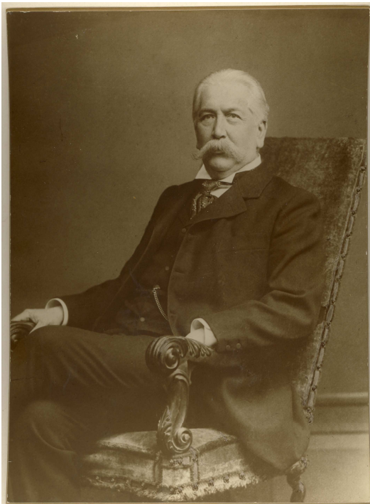
Adolf Kröner, 1836 – 1911

Um 1890 erwarb der Verleger und Besitzer des Cotta-Verlages, Adolf Kröner, das Landhaus.