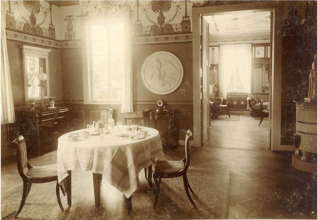
Blick in die Wohnräume, 1894