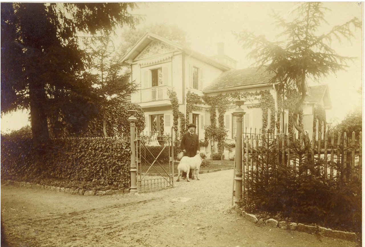
Das Berkheimer Schlößle, 1894

Bei dem Bombenangriff vom 28. Januar 1945 wurden 200 Häuser von Weilimdorf zerstört oder stark beschädigt. Damals ging auch der schönste Profanbau Weilimdorfs, das sogenannte „Berkheimer Schlößle“, in Flammen auf. Nur 109 Jahre ist es alt geworden und soll an dieser Stelle noch einmal mit seinen Besitzern und seiner Geschichte in Erinnerung gerufen werden.